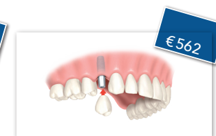
Kroon op implantaat metaal keramiek